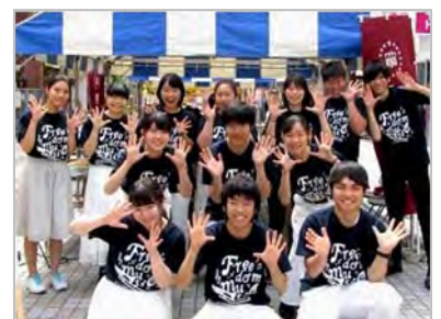
学生天国2019 Freedom Music