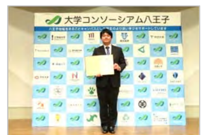
大学コンソーシアム八王子学生発表会で優秀賞を受賞