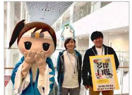
日野市観光協会「フレッシュちゃん （ひの新選組ポイントキャラクター）」

なお、この内容は地域交流センターNewsletter vol.4にて詳しく紹介しています。