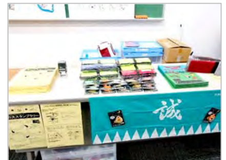
コラボスタンプラリー