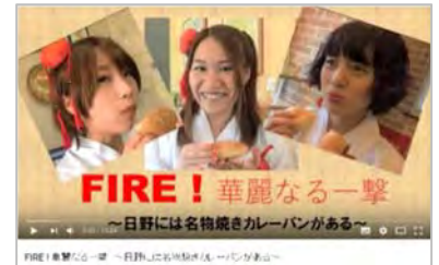
焼きカレーパン PR 動画 (YouTubeにてご覧頂けます)