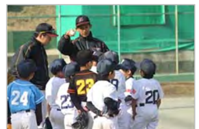
第3回日野市少年軟式野球教室 硬式野球部