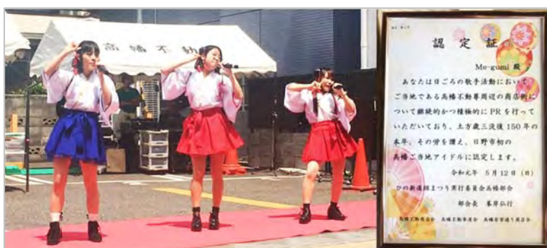
「ひの新選組まつり」 「Me-gumi」出演

明星大学では、掲載の他にも、多くの地域連携活動を行っています。活動は、随時 WEB サイトや SNS にて紹介しております。