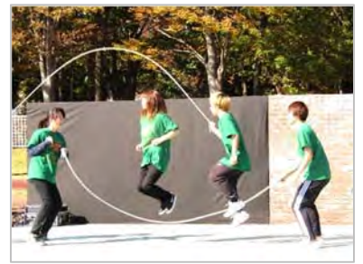
日野市産業まつりイベント ダブルダッチ同好会 Shakin key!!