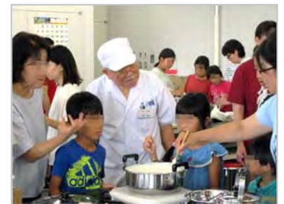
夏休み科学体験教室