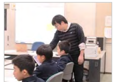
明星小学校でのプログラミング講座