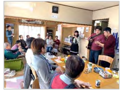
『アムール』での活動